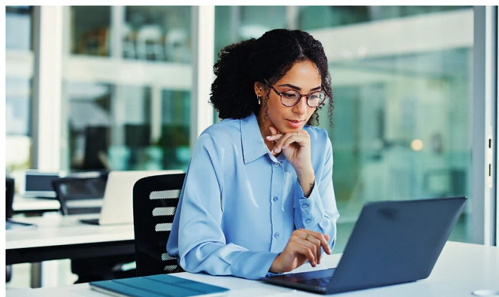
Eine Mitarbeiterin arbeitet konzentriert an einem Laptop, während sie auf individuelle Anlagestrategien abgestimmte Lösungen vorbereitet

In der praktischen Umsetzung bedeutet dies: Anleger investieren ihr Kapital nicht in spekulative Einzelwerte, sondern in breit gestreute, global ausgerichtete Fondsstrukturen. Das Besondere daran ist die Verzahnung